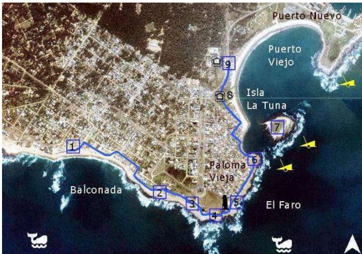
FIGURA 5. Vista aérea de La Paloma. La línea azul indica el proyecto "Senda costera", que se extiende desde La Balconada (1) hasta las inmediaciones de la vieja estación de trenes de AFE (9). El sendero constará, entre otras, de zonas equipadas para observación de la biota marina, para interpretación de naufragios y construcciones históricas y para sensibilización sobre contaminantes. Como ejemplo, en el punto (1) se encuentra proyectado un espacio acondicionado para la percepción de las especies del infralitoral de sustrato rocoso, especialmente peces y algas, así como para la observación de aves y cetáceos. En los puntos (4) y (5), el sendero se dirige a la interpretación de la zona del Faro, su historia y elementos para el reconocimiento de moluscos y restos de megafauna.

La Paloma debe consolidarse a través de una planificación que defina diversas acciones integradas. Una fundamental es la creación de un centro de interpretación para la población local y punto clave de orientación e información del visitante. Este centro constituirá en sí mismo un nuevo atractivo para la ciudad y la información que brindará incluirá aspectos sobre la cultura y la naturaleza regional, las áreas protegidas y los circuitos urbanos y rurales disponibles.