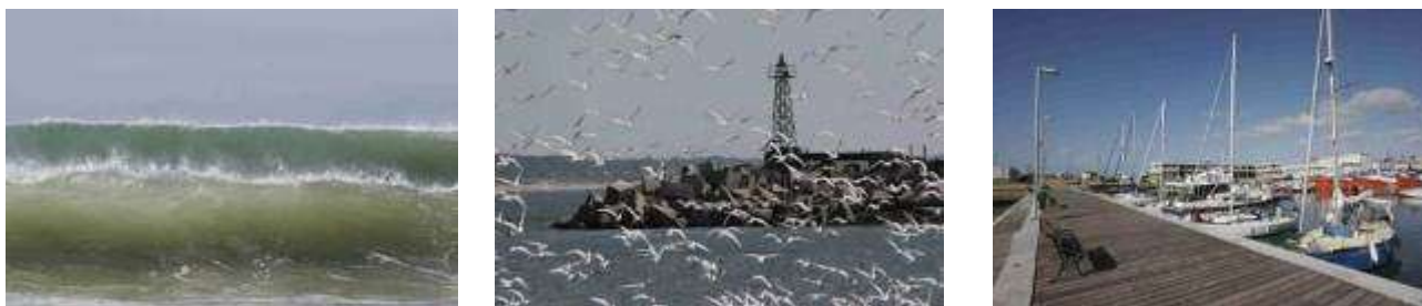
Izquierda: Olas en la playa La Aguada Centro: Escollera del puerto. Derecha: Muelle nuevo.

Dentro de las infraestructuras de apoyo a la comunidad imprescindibles para su adecuado desarrollo, la localidad de La Paloma presenta algunas limitantes, como por ejemplo la ausencia de un centro social abierto a todas las categorías de edad, que actúe como un espacio urbano poli funcional de encuentro, comunicación, recreación, práctica de deportes e intercambio social y cultural. Esta necesidad se hace particularmente evidente en el caso de los niños y jóvenes. El Polo Logístico aquí propuesto se visualiza como un espacio con cierta centralidad y cercano al mar para que traduzca el carácter e identidad sociocultural local. El concepto básico es el de un edificio polivalente, con espacios para reuniones que permitan el encuentro de grupos de diferente tamaño, salas de estar, biblioteca, cafetería, salas de juegos y sala de conferencias. Este Polo Logístico, si se lograra articular con la infraestructura ya existente en el área próxima a la Bahía Grande, abarcaría también las actividades deportivas por su proximidad al gimnasio cerrado, al puerto deportivo proyectado y a la propia playa. La cercanía con los principales centros educativos (Liceo de La Paloma y Escuela Nº 52, CAIF) y con el Centro Cultural Municipal, convertirían el área en un nodo de actividades educativas, deportivas, recreativas y culturales en La Paloma, sin necesidad de realizar obras de gran envergadura.