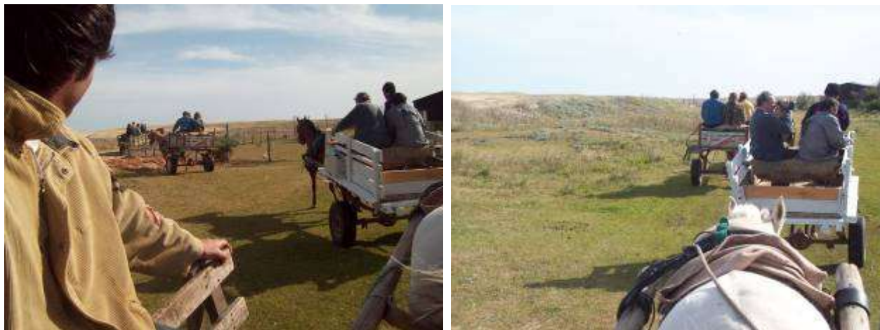
Paseo guiado en carros al Área Protegida Laguna de Rocha.

El proyecto de traslado del público a la Laguna de Rocha desde La Paloma forma parte de la propuesta que hiciera en 2006 la Comisión Asesora Específica Provisoria del Área Protegida Laguna de Rocha para el ingreso de esta área al Sistema Nacional de Áreas Protegidas (SNAP). La Laguna de Rocha fue efectivamente ingresada al SNAP en febrero del 2010.